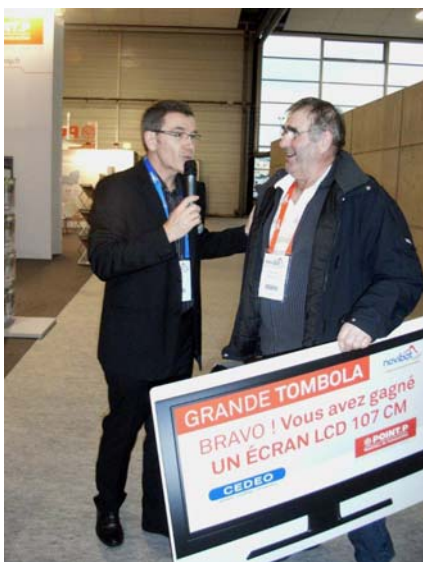
Salon professionnel à Rouen